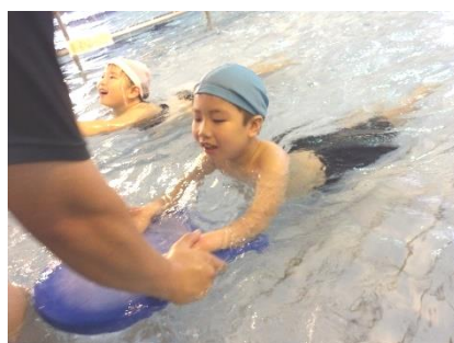
ガイシの プール指導