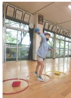
ストライクアウト指導